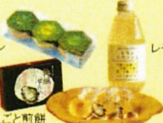
レモンスカッシュ