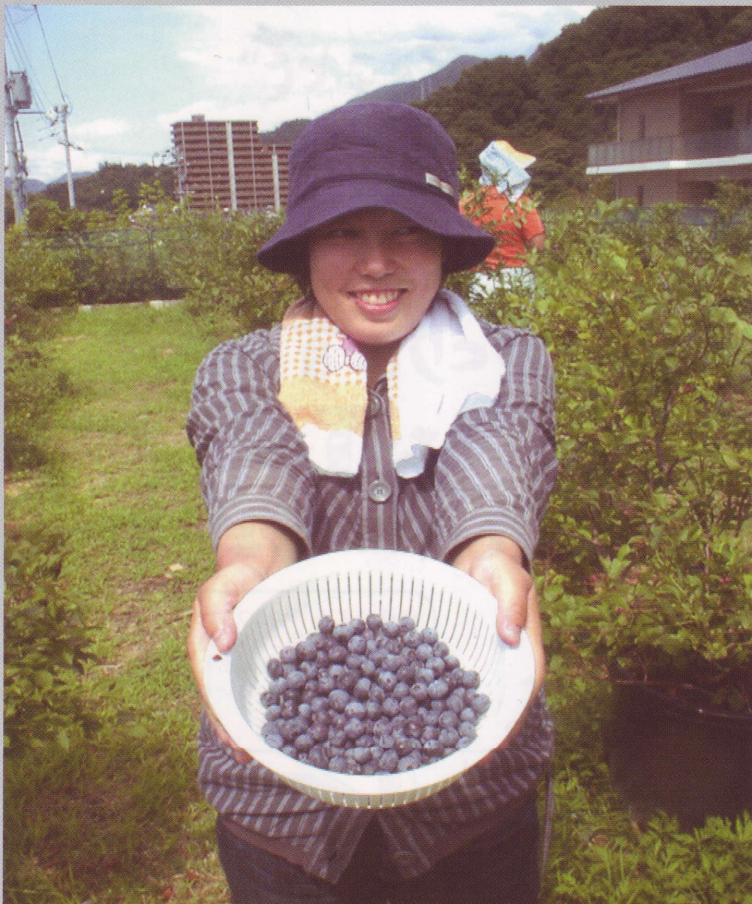
まつりでは、ブルーベリーの摘みとり体験ができます。無農薬なのでそのまま食べられます。今年から持ち帰りもできます。おいしいですよ！

とき 7月26日(土) 午後4時～8時 ところ 森の工房AMA (安芸区矢野東2丁目)